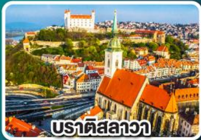
ปราตีสลาวา