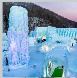
"LAKE SHIKOTSU FEST"