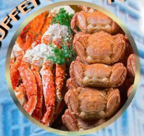
SAPPORO SNOW FESTIVAL 2027