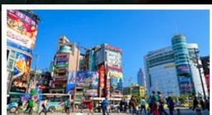
ซ้อปิ้งซีเหมินตง