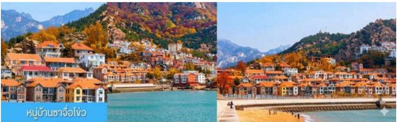
หมู่บ้านซาจื่อโ้ว

พักที่ WEIHAI BOYUE HOTEL / WEIHAI JIANGUO PUYIN โรงแรมระดับ 4 ดาวท้องถิ่นเมืองเวย์ไห่