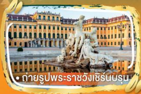
• ถ่ายรูปพระราชวังเชิร์นบรุน