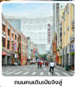
ถนนคนเดินเป่ย์จิงสู๋