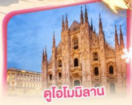
คูโอไมมิลาน