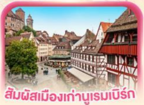
สัมผัสเมืองเก่าบูร์ก