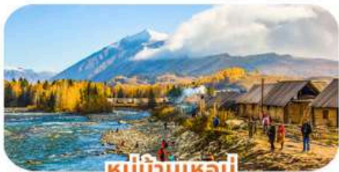
หมู่บ้านเหม่มี