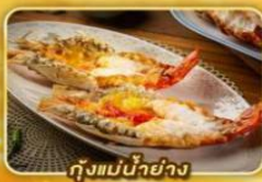
กุ้งแม่น้ำย่าง