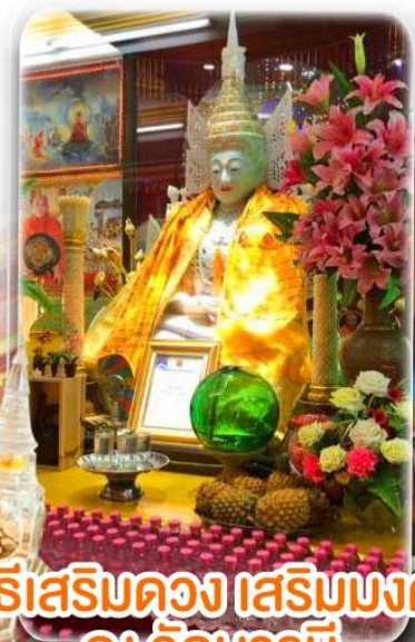
พิธีเสริมดวง เสริมมงคล ณ วัดบารมี

ได้เวลาอันสมควร ตามเวลานัดหมาย นำท่านเดินทางสู่ สนามบินเพื่อทำการเช็คอินเอกสารแก่ท่าน