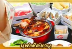
บู่ไฟผัดชาบู