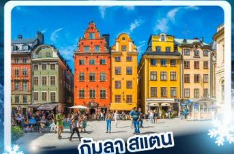
♨️ กับลาสแตน