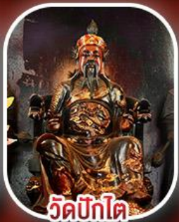
วัดปิกไต่