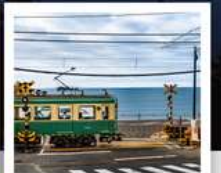
รถไฟโอบุเอะดิน