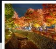
อุโมงค์เมบิซึ