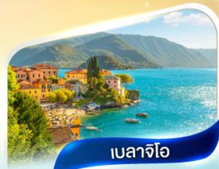
เบลาจีโอ