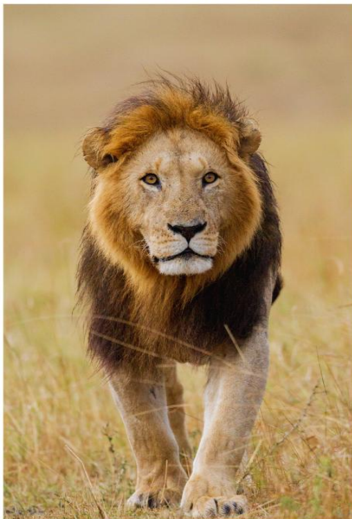
BIG FIVE GAME DRIVE

สัมผัสประสบการณ์สุดตื่นเต้น ชมสัตว์ป่าอย่างใกล้ชิดท่ามกลางธรรมชาติอันอุดมสมบูรณ์ ตื่นตาตื่นใจไปกับ "Big Five" อันเลื่องชื่อ ได้แก่ สิงโต ช้าง แรด ควายป่า และเสือดาว ที่ออกมาใช้ชีวิตอย่างอิสระในถิ่นอาศัยตามธรรมชาติ อีกหนึ่งไฮไลท์ที่ไม่ควรพลาด คือโอกาสในการชมปรากฏการณ์การอพยพของสัตว์ป่าขนาดใหญ่ ซึ่งชวนให้นึกถึงภาพอันยิ่งใหญ่คล้ายของ Maasai Mara National Reserve ที่มีชื่อเสียงระดับโลก