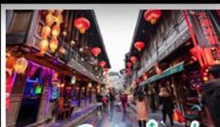
ถนนโบราณจิ้นหลี่