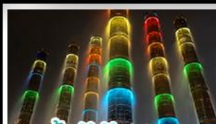
น้ำพุไม้ไผ่ตึกSKP