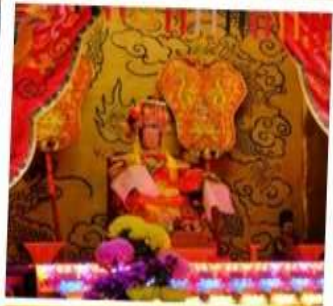
เจ้าแม่ทับทิม จอสเฮ้าส์เบย์