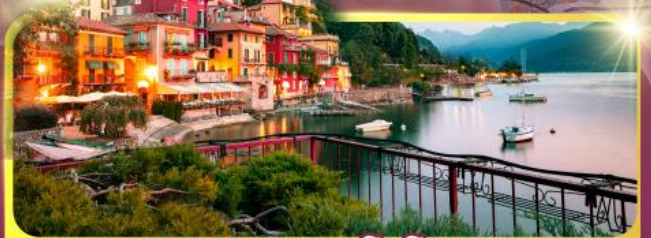
ทะเลสาบโลโบ