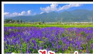
สวนดอกไม้ฮาวอวูมี้อ่าง