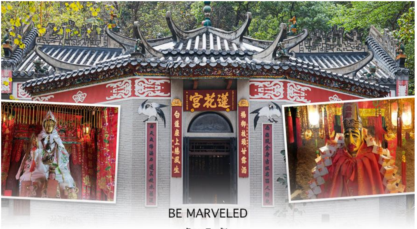
BE MARVELED วัดหลินฟ้า

เที่ยง ๑๐ รับประทานอาหารเที่ยง ที่ภัตตาคาร