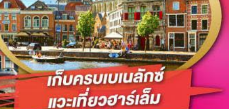
เก็บครบเบเนลักซ์ และเที่ยวฮาร์เล็ม