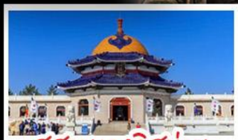
สุสานเจกิสข่าน