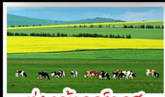
ทุ่งหญ้าเออร์ดอส

ทุ่งหญ้าเออร์ดอส สุสานเจกิสข่าน แกรนด์แคนยอนแม่น้ำเหลือง