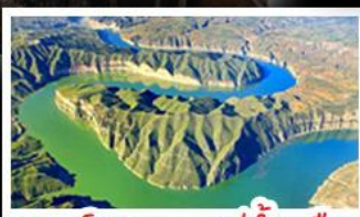
แกรนด์แคนยอนแม่น้ำเหลือง