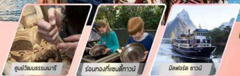
ศูนย์วัฒนธรรมเมารี

เที่ยวเกาะใต้ และเกาะเหนือ : 12 วัน 10 คืน