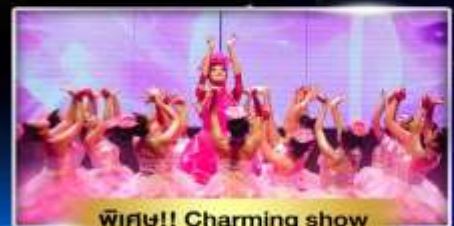
พิเศษ!! Charming show