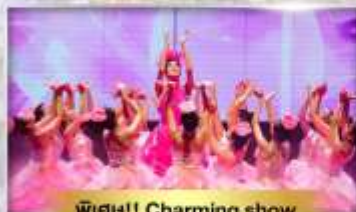
พิเศษ!! Charming show