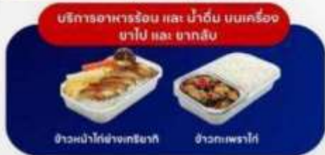
บริการอาหารร้อน และ น้ำดื่ม บนเครื่อง ยาไป และ ขากลับ