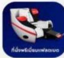
ที่นั่งพนักมือบนเฟลทเบด