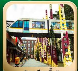
“ตงเจียวจื่อ”