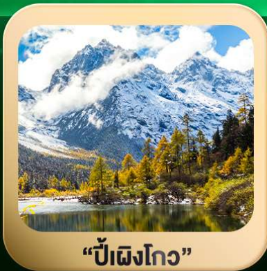
“ปี่ผิงโกว”

T2G-TFU25SL Basic Chengdu...เจิงตู สีดรุณี ปี่ผิงโกว 4D 3N (SL)