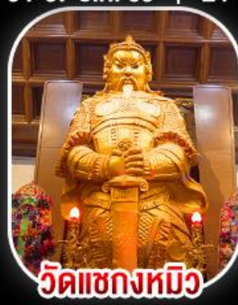
วัดเขกหมิว

วัดเขกหมิว- วัดเจ้าแม่กวนอิมฮ่องกง พระใหญ่ไผ่หลิน + กระเช้าเองปีง เบนสุดพิเศษ!! ตีมซาเองก บูฟพีตซาบูสโตลเองก และห่านย่ง อีสูระ-ทเองกเทียวดิสนีย์แลนด์ 1 วัน เลือกซื้อบัตรดิสนีย์แลนด์หรือซ้อปึงจู่ใจ