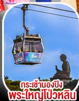
กระเช้าเองปีง พระใหญ่ไผ่หลิน