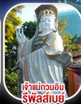
เจ้าแม่กวนอิม รีพัสลีย์