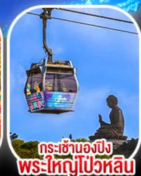
กระเช้าเองปีง พระใหญ่โป่วหลิน