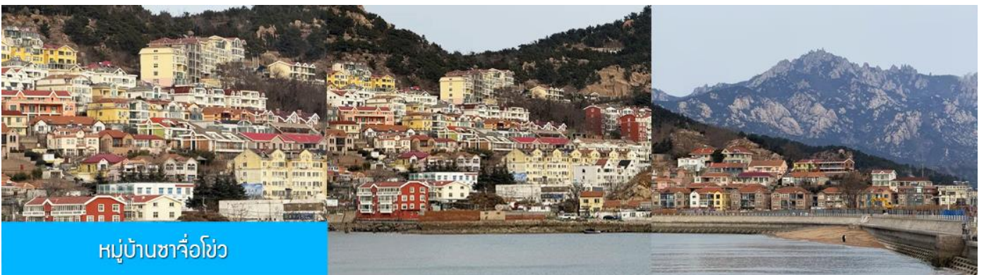
หมู่บ้านซาจื่อโข่ว

เที่ยง รับประทานอาหารกลางวัน ณ ภัตตาคาร (มื้อที่ 7)