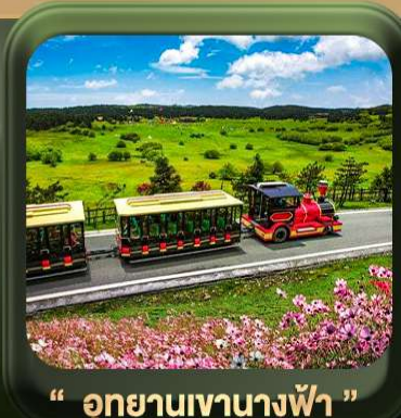
“ อุทยานเขานางฟ้า ”

T2G-CKG26CZ Special of Chongqing... ซึ่ง อุโมงค์ ต้าจู๋ อุทยานหลุมฟ้า เขานางฟ้า 5D 3N (CZ)