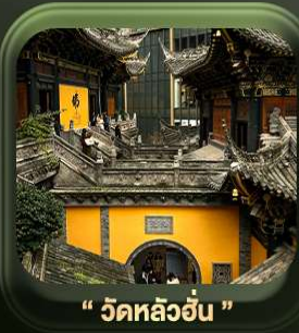
“ วัดหลิวอัน ”