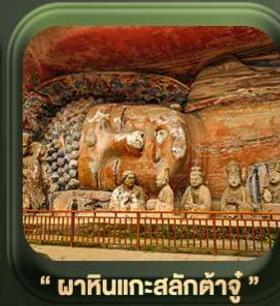
“ ผาหินแกะสลักต้าจู๋ ”