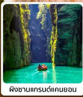
ผิงซานแกรนด์แคนยอน