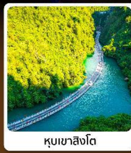
คุบเขาสิงโต

ไฮไลท์! ปีนตรงลงเอนชอ ที่ยาวเอนชอนั้นๆจัดทีมทั่วเมือง คุบเขาสิงโต ผิงซานแกรนด์แคนยอน อุทยานจันลู่ซาน