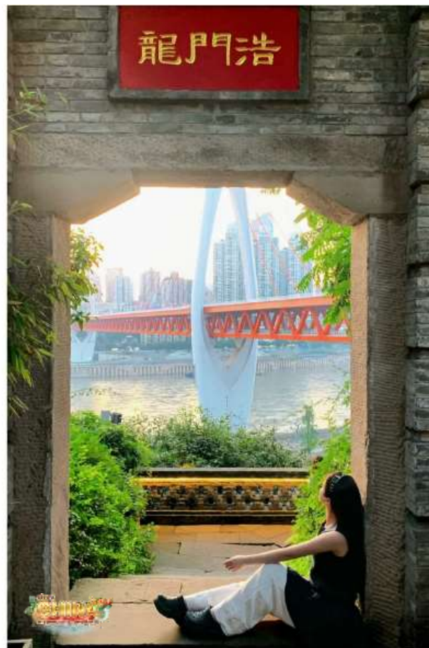
✔ "Xia Hao Li" Long Men Hao Old Street

เย็น ที่พัก ๑๐ บริการอาหารเย็น ณ ภัตตาคาร พักที่ HOLIDAY INN EXPRESS HOTEL