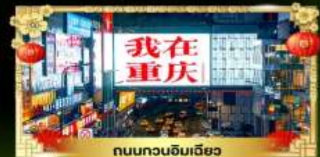
ถนนทวงจิมเฉียว