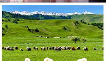
ทุ่งหญ้าหาลาดิ