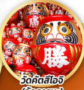
วัดคัตสึโองิ (วัดदारุมะ)

ชมความงามของกำแพงหิมะ เส้นทางสายอัลไพน์ ทากายามา (JAPAN ALPS SNOW WALL)