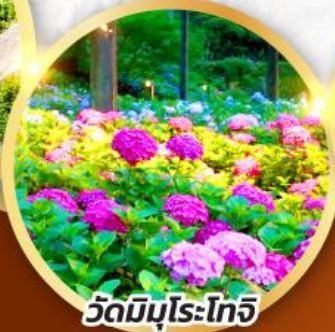
วัดมิอุโระโทจิ