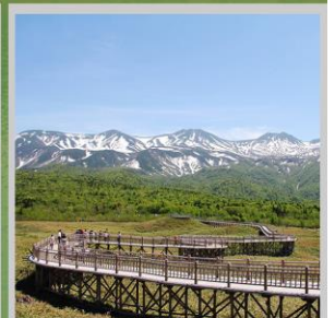
"SHIRETOKO 5 LAKES"