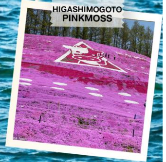
HIGASHIMO GOTO PINKMOSS