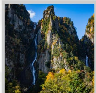
"GINGA & RYUSEI FALLS"

ต้นตา "ทุ่งดอกพืชมอส ณ สวนดอกชิบะซากุระฮิงะชิโมะโคะโคะ" ด้วยพรมสีชมพูที่มีพื้นที่ขนาดใหญ่ถึง 100,000 ตารางเมตร ชม "ทะเลสาบคาบสมุทรชิเรโตโก" เกิดมาจากการระเบิดของภูเขาไฟโอโอะและน้ำพุใต้ดิน จนเกิดเป็นทะเลสาบทั้ง 5 ของชิเรโตโก "ฟาร์มสุนัขจิ้งจอกฮอกไกโด" ฟาร์มสุนัขจิ้งจอกแห่งเดียวของเกาะฮอกไกโด สายพันธุ์ท้องถิ่นคือ สายพันธุ์ Ezo red fox ผลิตเพลินกับ "เนินสีฤดู" เนินเขากว้างใหญ่ที่มีดอกไม้ไม้บานาพันธุ์นับ 30 ชนิดปลูกเรียงรายสลับสีกันเป็นแนวยาว นำท่าน "นั่งกระเช้าภูเขาคุโรดะเคะ" เชื่อมจากเชิงเขาของเมืองโซอุนเคียวถึงยอดเขาคุโรดะเคะเคะที่มีความสูงถึง 670 เมตร ไฮไลท์ "ส่องเรือราอูสี ชมความงามของวาฬเพชรฆาต" บริเวณคาบสมุทรชิเรโตโก มรดกโลกทางธรรมชาติของฮอกไกโด