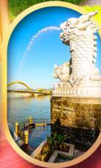
คาร์พดราท็อน