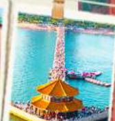
สะพานจันเจียว