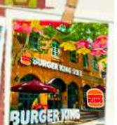
ย่านเมืองเก่า