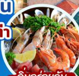
อิ่มอร่อยกับเมนูซีฟู้ด