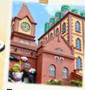
โรงงานเบียร์