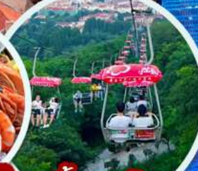
ขึ้นกระเช้าภูเขาไท่ผิง