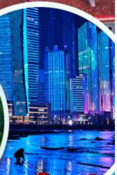
หาดไซเบอร์ Bathing Beach