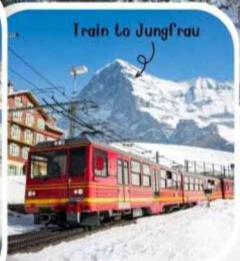
Train to Jungfrau